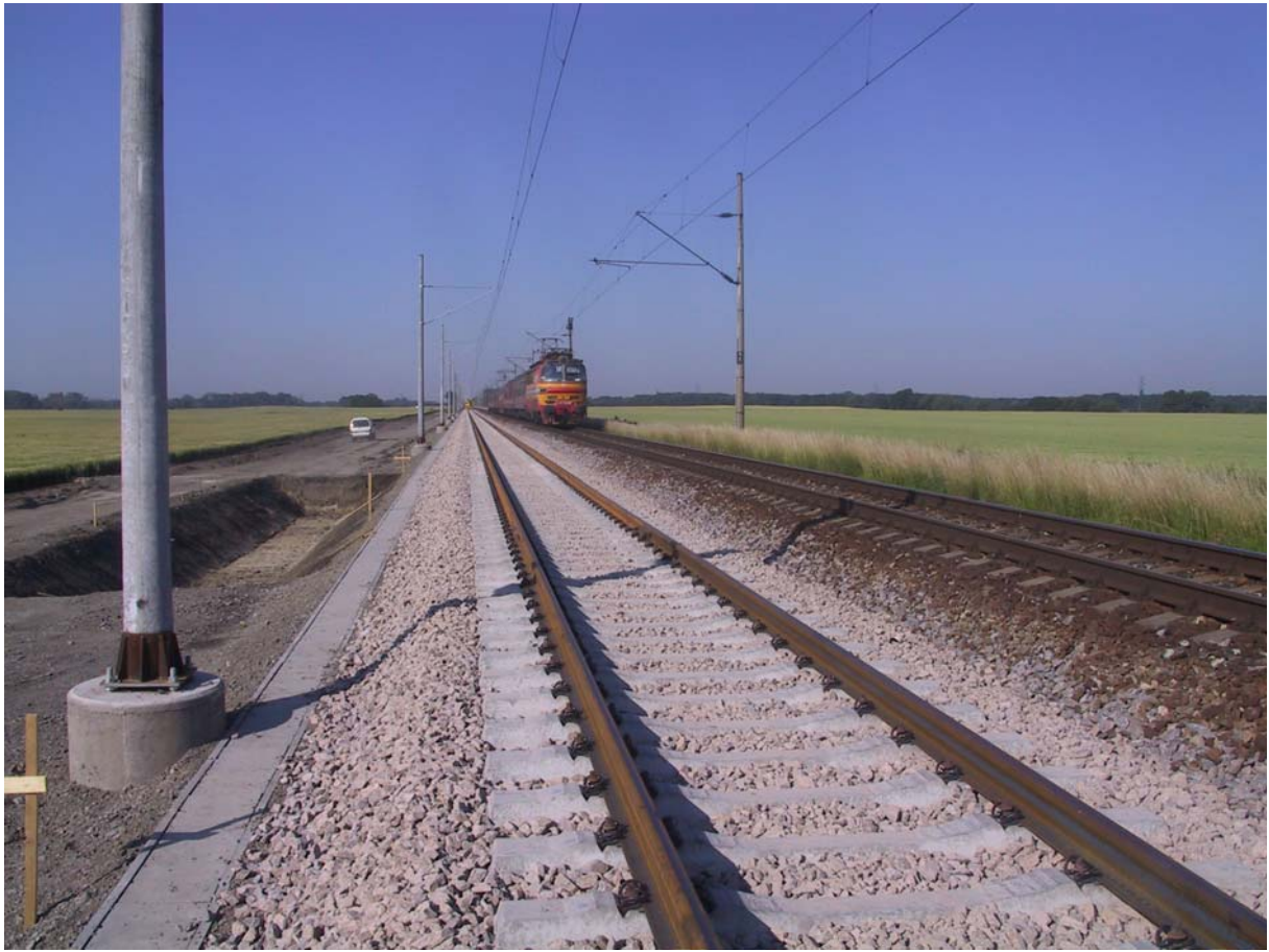
Brestovany – Leopoldov, modernised section of track number one