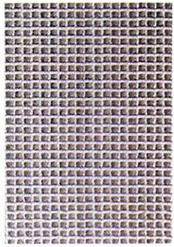
Fig. 3 The MACRIT GTV 50/50 B geocomposite

L'utilizzo di una pendenza del 3% ha permesso di ridurre notevolmente il volume dei lavori relativi al terrapieno sia in fase di scavo della struttura inferiore della ferrovia, che durante la fase progettuale del canale di drenaggio.