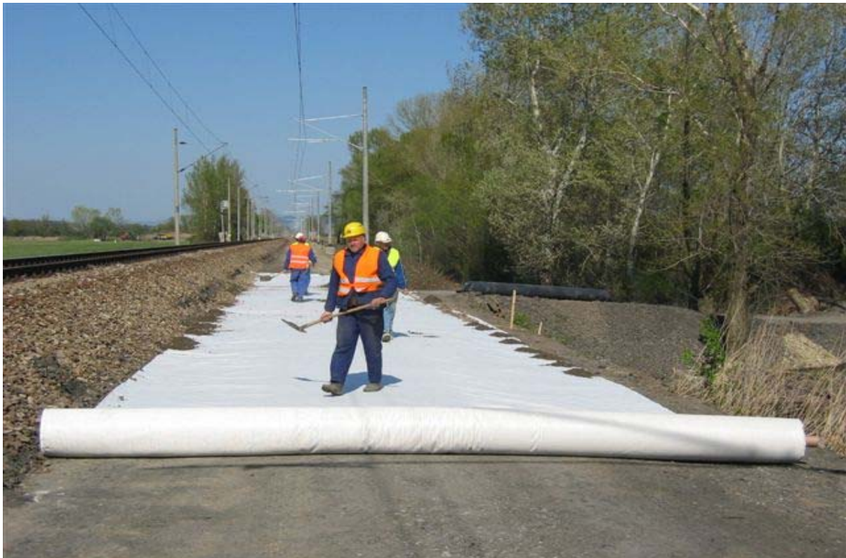
Brestovany – Leopoldov, laying the MACRIT GTV 50/50 B geocomposite