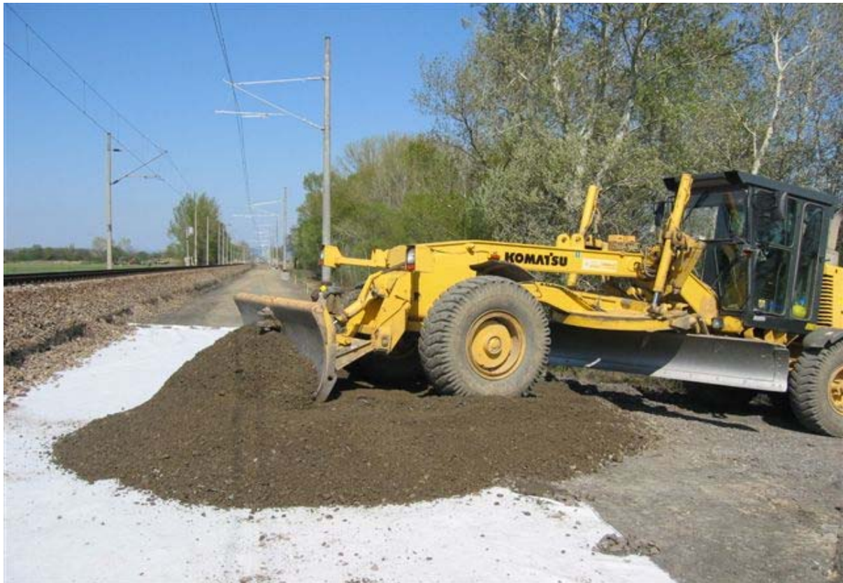
Brestovany – Leopoldov, spreading the base layer of crushed gravel fraction 0 – 32 mm