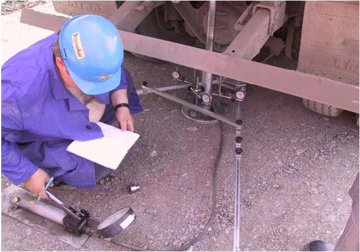
Brestovany – Leopoldov, static loading test of the earth subgrade